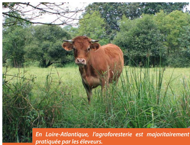
En Loire-Atlantique, l'agroforesterie est majoritairement pratiquée par les éleveurs.

En 2015, la Chambre d'agriculture envisage de créer un collectif d'agriculteurs afin d'étudier l'impact de l'agroforesterie en vérifiant et analysant ses résultats. Cette étude permettra de réaliser des fiches techniques ainsi qu'un protocole listant les différents avantages. La composition de ce collectif sera très éclectique puisqu'éleveurs, agriculteurs pratiquant l'agroforesterie ou curieux sont les bienvenus. « C'est un sujet qui rassemble tout le monde, il n'y a pas une solution unique ; ce sont les agriculteurs qui détiennent les solutions. »