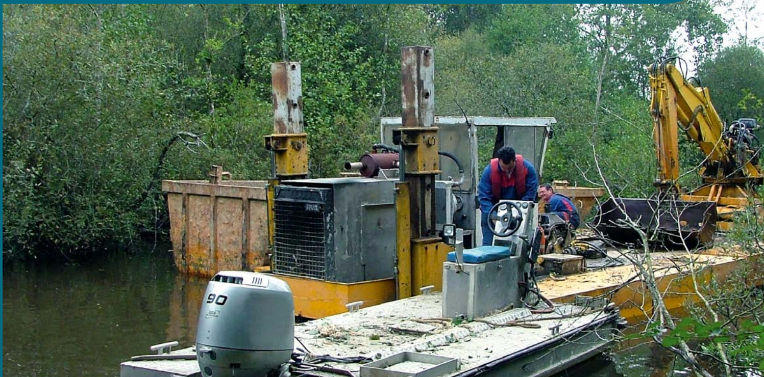
Les systèmes restaurés nécessitent moins d'entretien.

Élus locaux, professionnels de l'environnement et associations ont répondu présents à l'invitation de l'EDENN pour la troisième Conférence des Acteurs de l'Erdre. Ce rendez-vous désormais attendu s'est déroulé le 10 décembre 2014 à Nort-sur-Erdre en présence d'un public nombreux et impliqué. Parmi les thèmes abordés, celui de la restauration des milieux aquatiques se signale comme central lorsque l'on traite de la qualité de l'eau.