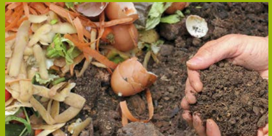
Issu de la décomposition des déchets ménagers, le compost constitue un engrais naturel et gratuit