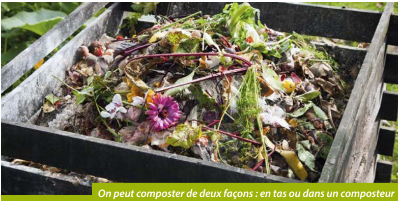
On peut composter de deux façons : en tas ou dans un composteur

Si vous jardinez déjà au naturel, vous pratiquez certainement le compostage. Découvrons cette façon simple et durable d'apporter à votre jardin les nutriments nécessaires.