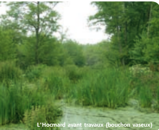
L'Hocmard avant travaux (bouchon vaseux)