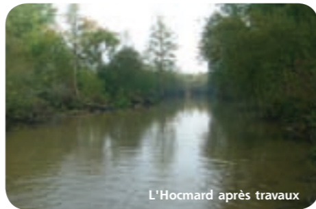
L'Hocmard après travaux

3 ème phase : programme de travaux, de suivi et définition du rôle des maîtres d'ouvrage locaux (public/privé - associations de protection de l'environnement et associations de propriétaires) qui porteront localement les travaux, modalités de financement par l'Agence de l'Eau, la Région et le Département.