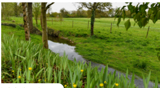
La Gachetière après travaux

Nature des travaux / Réduction du plan d'eau et suppression du clapet. La rivière a été reméandrée (fait de redonner une morphologie sinueuse), le lit a été réduit par l'apport de cailloux de différentes tailles sur les côtés.