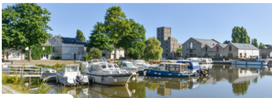
Le port de Nort-sur-Erdre

La synthèse des données faune et flore sur la zone Natura 2000 des marais de l'Erdre sera bientôt achevée (lire ci-dessus). C'est le bon moment pour préparer la candidature à la labellisation Ramsar, en vue d'un dépôt courant 2023. La convention internationale de Ramsar vise la conservation et la gestion rationnelle des zones humides. Elle s'étend à tous les aspects de la biodiversité (faune, flore, enjeux hydrauliques..) jusqu'à la préservation des activités sociales et culturelles liées aux milieux humides. Les marais de l'Erdre, déjà sous plan de gestion Natura 2000, sont tout à fait éligibles à cette reconnaissance.