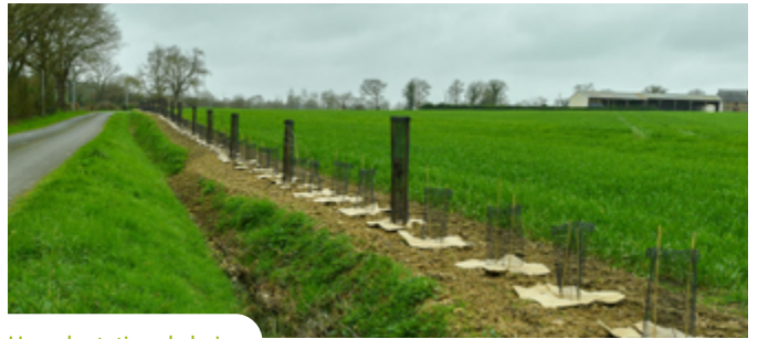
Une plantation de haies

Q Lire les témoignages d'agriculteurs dans la Feuille agricole n°1 d'avril 2022 sur le site de l'Edenn.