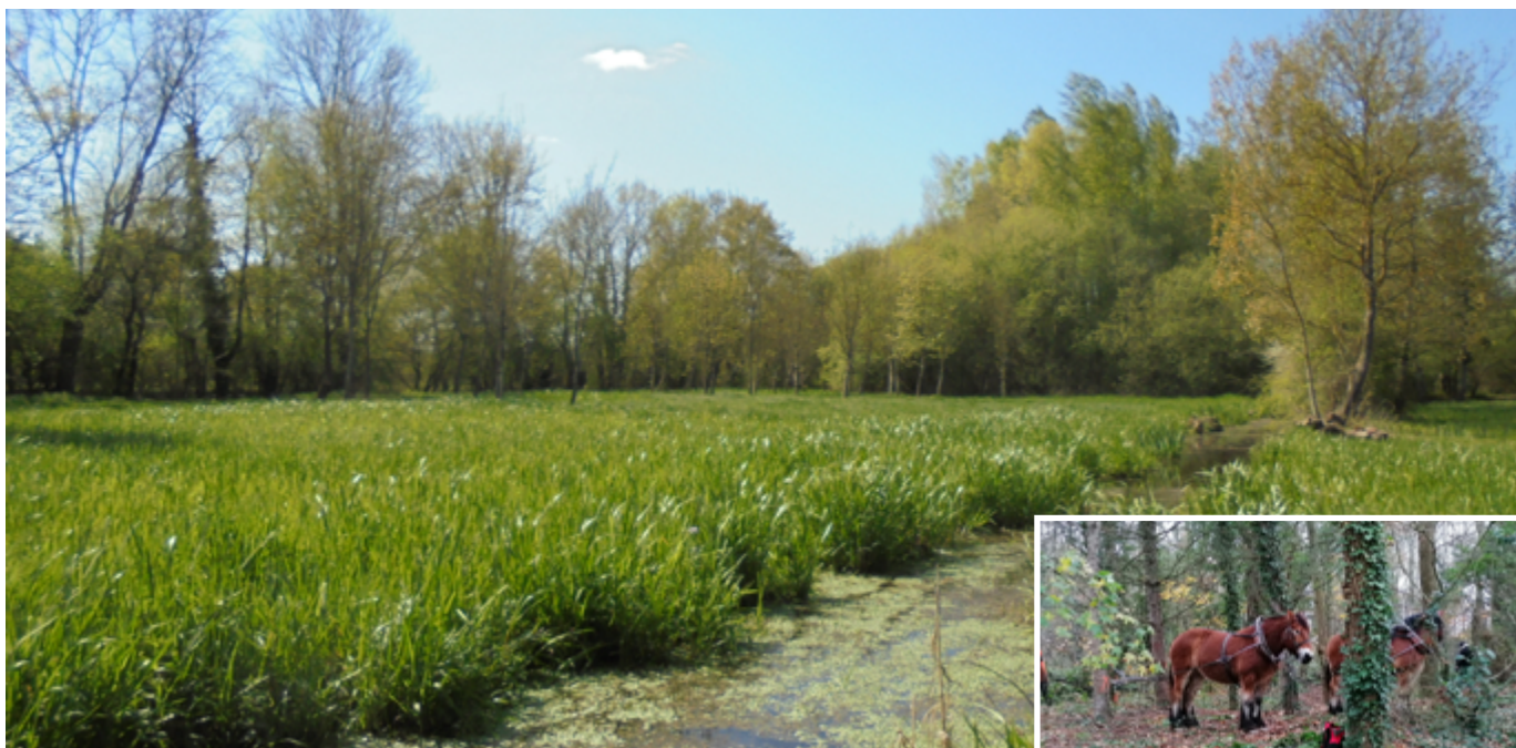
Le cheval de trait a été utilisé pour maintenir ce milieu sensible en l'état

Pierrick Guégan : Une sensibilisation sur site via un parcours pédagogique sera également réalisée en 2023. C'est une opportunité d'avoir un marais à proximité. Les scolaires s'y rendront à pied. L'objectif est de sensibiliser les habitants à la protection de cet espace et d'en faire un lieu de suivi de la faune et de la flore.