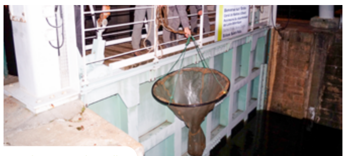
Suivi des entrées de civelles

Le brochet est une espèce repère pour les zones humides. En dix ans, la Fédération de pêche a restauré une dizaine de frayères à brochets avec différents maîtres d'ouvrage (communauté de communes d'Erdre&Gesvres, Ville de Nantes...). Six zones entre Nantes et Nort-sur-Erdre font l'objet d'un suivi scientifique régulier. Des alevins de brochets ont été capturés sur cinq des six zones suivies avec, pour certaines zones, de fortes concentrations.