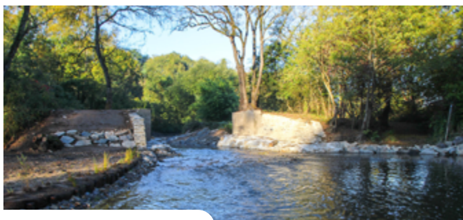
Le moulin de Vault après travaux

Dès maintenant / Une large banquette réalisée dans le plan d'eau de Vault resserre les écoulements et évite son envasement. En cas d'inondation, le lit peut s'élargir sur ces zones. La migration des poissons, dont l'anguille, est à présent rétablie sur cette portion de l'Erdre.