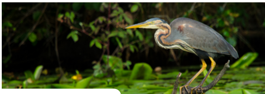
Un héron pourpre dans les marais de l'Erdre

La LPO a démarré en février 2022 une étude de 9 mois sur l'évolution des habitats et des populations d'oiseaux dans les marais de l'Erdre. L'étude s'étend sur toute la Zone de Protection Spéciale des oiseaux (site Natura 2000), ainsi que sur les vallons de l'Hocmard et du Verdier. Recherche bibliographique, inventaire de terrain, atlas des habitats et une trentaine de fiches d'espèces sont les attendus de ce rapport. Il servira de base à la révision du document d'objectifs sur le volet « oiseaux » de la zone Natura 2000, en 2023-2024. Pour le volet « habitats faune et flore », il reste quelques espèces animales à étudier, tandis que la cartographie floristique est finalisée depuis 2021. Pour plus d'infos, consultez le site de l'Edenn.